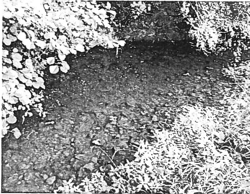
La Dhuis en aval de la prise d'eau, photographie prise le 31/08/2016 à Pargny-la-Dhuis