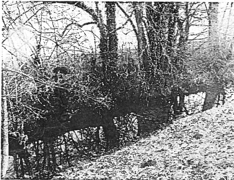
La Dhuis en aval de la prise d'eau, photographie prise le 14/02/2017 à Pargny-la-Dhuis